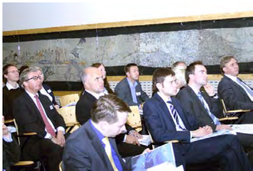
HR-seminar hos Telenor, oktober 2007

To nye kurs ble introdusert i 2007 med sikte på kompetanseheving av både gamle og nye medlemmer. Foredragsholdere var i hovedsak kammerets egne medlemmer som formidlet ervervet kunnskap til andre medlemmer og ikke-medlemmer. Også eksterne krefter ble trukket inn som foredragsholdere. Kursene var åpne for ikke-medlemmer og omfattet følgende temaer i 2007: