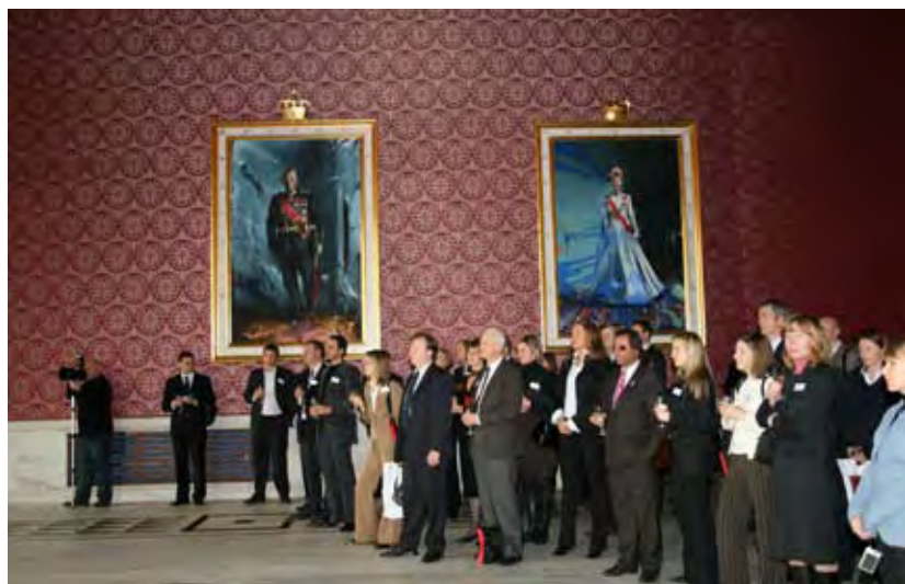
St. Petersburg-næringslivsseminar, november 2007

Seminarer fant sted i Oslo Rådhus som ga en solid og vakker ramme for både besøket og se-